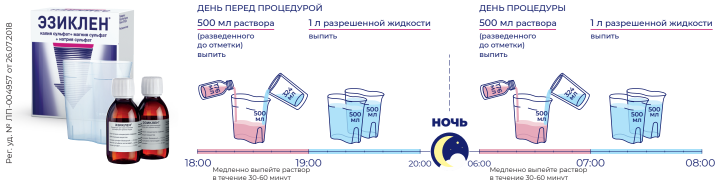
Схема ДВУХЭТАПНОГО приема препарата, если колоноскопия назначена на ПЕРВУЮ половину дня (до 13:00)**

Схема приема препарата в режиме дробного применения в случае, если процедура назначена, например, на 10 ч утра